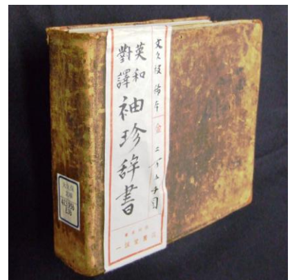
『英和对訳袖珍辞書』堀達之助編(文久2年1862)立教大学図書館大久保文庫蔵、洋書調所から刊行。日本初の英和辞典と言われる。

英和辞典では、柴田昌吉・子安峻『附音挿図英和字彙』(1873 刊 日就社)、神田乃武・横井時敬・高楠順次郎ほか編『新訳英和辞典』(1902 刊 三省堂)、岡倉由三郎編『新英和大辞典』(1927 刊 研究社)など多くの大型辞書が出版される一方、小型辞典では神田乃武・金沢久共編『袖珍コンサイス英和辞典』(1922 刊 三省堂)を皮切りに続々と出版された。