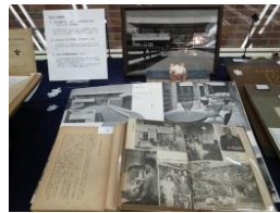
図書館案内 1955、「立教生活」