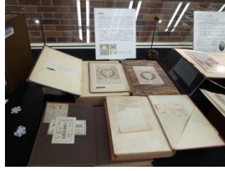
戦前の蔵書票など