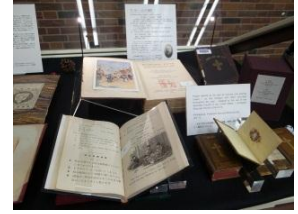
アーサー・ロイド総理の著書