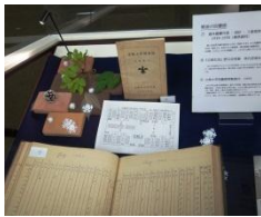
1939-58の貸本図書月表 (利用統計)