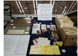
文献資料探索の手引き、カード