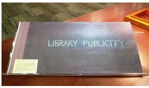
戦時中の新聞記事スクラップブック