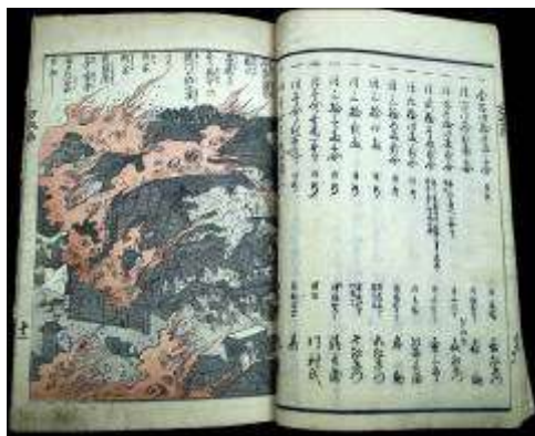
深川の出火と御救小屋(おすくいごや)等への寄進リスト

安政元年11月4日に東海地震が、翌日の5日には南海地震が起こり、大阪に大津波が来るなど中部・関西地域で数千人の死者があったと言われています。これらの地震は江戸にはあまり大きな影響は与えませんでした。翌年の安政2年の午後10時ごろ突如、江戸を直下型の地震が襲いました。江戸城の石垣が崩れるなど地震の直接被害にも増して火災による被害も大きく、深川・本所・浅草・下谷などを中心に4千人以上が亡くなりました。