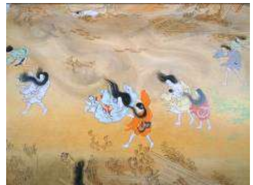
「辻風」（竜巻）平家物語絵巻より

しかし、十日、二十日と経つうちに、しだいに間隔が遠くなっていった。ある日には一日に四、五回、それが二、三回になり、もしくは一日おき、二、三日おきに一回というふうに減っていった。おおよそ三か月ほど余震が続いたように思う。”