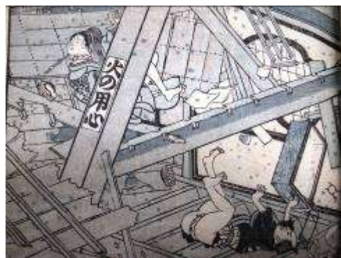
新吉原遊女屋の倒壊