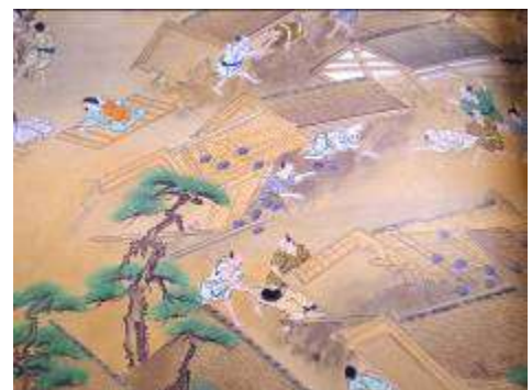
「元暦の大震災」平家物語絵巻より

※現代語訳は、『方丈記』武田友宏著（角川ソフィア文庫：ビギナーズクラシックス 2007）から引用させていただきました。