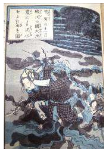
泥水が噴き出た図