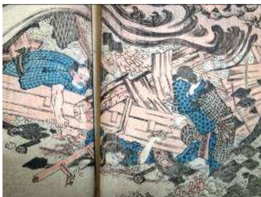
娘を助けようとする夫婦

“大江戸では地震がめったになく、おりおり小地震があっても、屋根瓦を落とすほどではない。そこで俗に、江戸には「掘り抜きの井」といわれる井戸が多いが、そこから陽の気が常に発散しているのだ、大地震が少ないのだ、とって人々はすっかり安心してた。・・・” (荒川秀俊著『実録・大江戸壊滅の日』より)