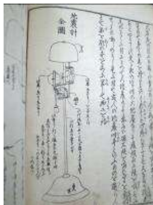
磁石を使った地震計の案