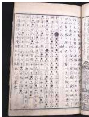
余震の頻度や強さの記録