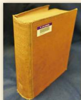
Dictionary of Philosophy and Psychology

現在、図書館の蔵書は約190万冊ありますが、登録番号は00000001番から始まり、大会計基準が整備された1970年代からは年度ごとの一連番号になり、1980年代に業務がコンピュータ化されて以降は51000001から新たに番号付けが始まっています。