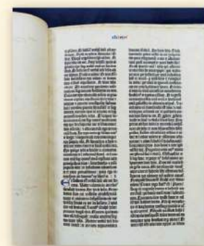
グーテンベルク42行聖書 零葉 (庄司浅水コレクションより)

築地時代のキャンパスには立教大学校、壮麗な聖三一大聖堂、三一神学校などが立ち並び、当時の街のシンボルともいわれた六角塔の校舎の3階、4階には書庫もあったという記録がありますので、こうした貴重書も当時から大事に保管されていたと考えられます。