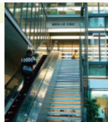
エスカレーターで2階へ

学術メディアセンターに着いたらエスカレーターに乗って2階へ向かいましょう。そこが図書館の入口です。