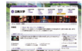
立教大学図書館ウェブ

山手線コンソーシアム検索： http://opac.rikkyo.ac.jp/hybrid/