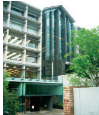
学術メディアセンター

今回は山手線沿線私立大学コンソーシアムの中でも、一番新しく建てられた國學院大学の渋谷キャンパスにある図書館を紹介します。