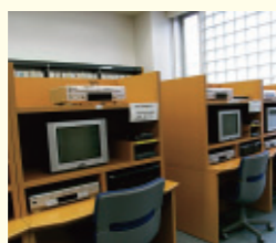
メディアライブラリー