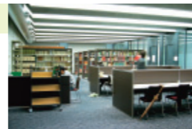
分野毎の配架、近くには閲覧テーブル

本の並び方は立教大学と少し違って、それぞれの分野毎に一般書、参考図書、雑誌がまとめて同じエリアに並べられています。そのため、調べたいテーマによっては、調べたいテーマによっては、同じスペースで効率的に学習できます。