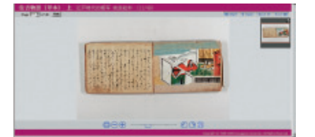
デジタルライブラリー

國學院大学渋谷キャンパス図書館を訪ねたら、隣接している伝統文化リサーチセンター資料館に行ってみましょう。テーマは「モノと心に学ぶ伝統の知恵と実践」、祭祀遺跡、神社祭礼についての展示や國學院大学の歴史に関する貴重なコレクションを見ることができます。ふだんは見ることのできない貴重な「モノ」を体験できます。美しく落ち着いた資料館で、きっとみなさんの探究心を呼び覚ましてくれることでしょう。