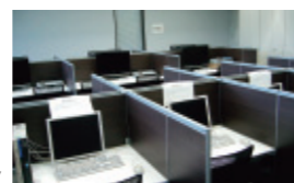
オンラインデータベース専用パソコン