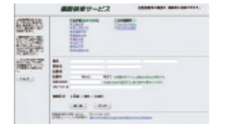
山手線コンソーシアム検索