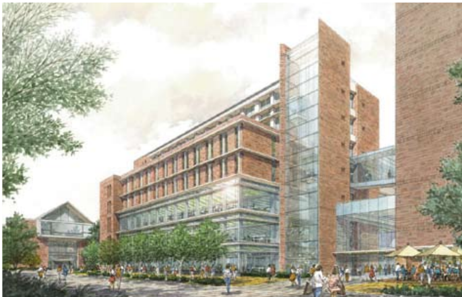
(注：イメージ図です。実際には手前側に10号館があります。)