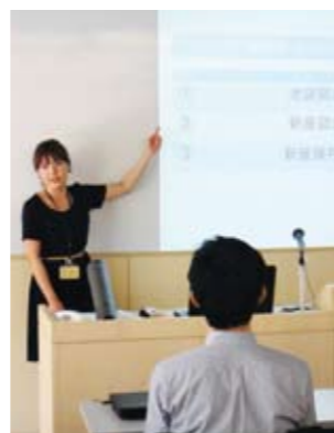
池袋：全3回セット 新座：カスタマイズ制

レポートを書くためにはいくつかの材料（資料）が必要です。図書館活用講座では、検索キーワードの選び方から、書架へ本・雑誌記事を探しに行く実習まで、資料を効率的に集める方法を学ぶことができます。