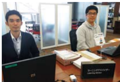
池袋図書館2Fカウンター、新座図書館2F「しおり」にあります

迷ったらどんな些細なことでもOK、まずはラーニングアドバイザーに相談してみましょう。大学院生のラーニングアドバイザーが、丁寧にアドバイスします。「何を書いたらいいのかわからない」そんな悩みをそのまま相談してください。参考資料の探し方や、レポートの体裁など様々な疑問にお答えします。一人でもグループでも大歓迎です。